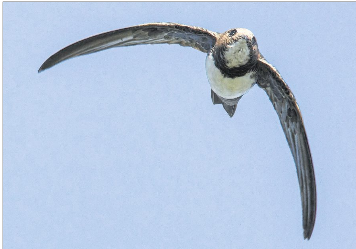
DER ALPENSEGLER ist unverkennbar dank weißer Unterseite, der markanten Silhouette und dem rasanten Flugmodus, den man sonst nur vom Mauersegler kennt. Jetzt hat auch der größere Segler die Fächerstadt als weltweit nördlichstes Brutrevier entdeckt.

Ganz sicher sind sich die Experten, wer der Neuling ist. Weißer Bauch und weiße Kehle bei rasanter Flugweise mit typischer Seglersilhouette, da gibt es kein Vertun. Schwalben oder andere Felsenbrüter – Taube, Dohle oder Hausrotschwanz – wählen solche Nischen nicht. Segler hingegen fliegen auf sie, denn sie haben besondere Bedürfnisse, erklärt Havelka in begeistertem Mannheimer Zungenschlag. Alle Seglerarten stehen auf äußerst schwachen Füßen. Zum Start müssen sie